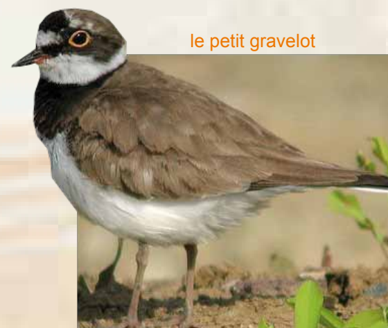
le petit gravelot

Le classement de l'Ecoparc de Mercey comme refuge LPO sera bientôt à l'ordre du jour.